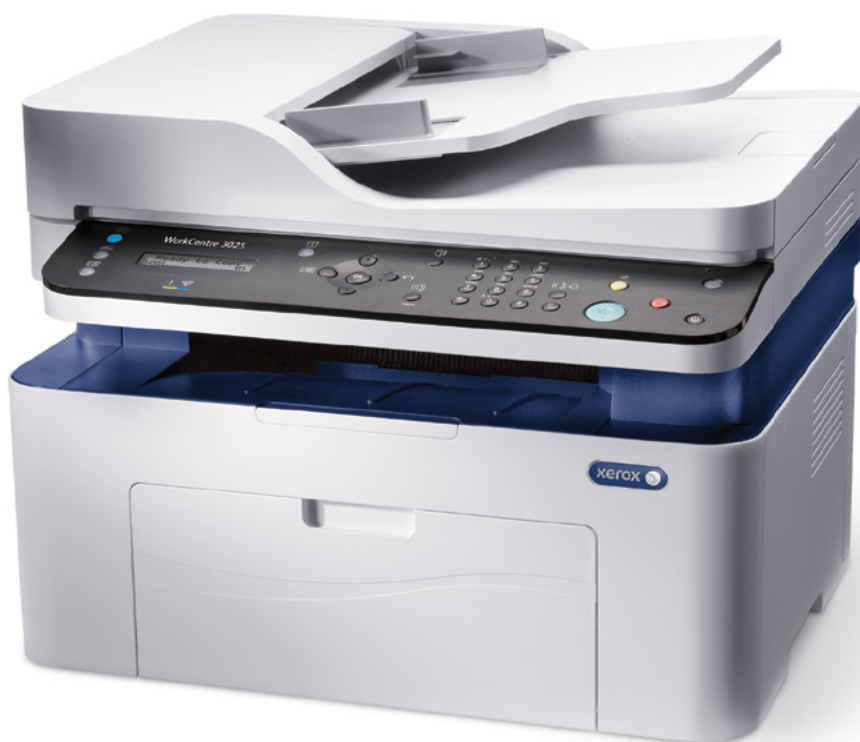
WorkCentre 3025. Copiere. Imprimare. Scanare. Fax.*

* Faxul și dispozitivul automat de alimentare sunt disponibile numai la WorkCentre 3025NI.