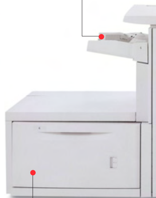
Dispozitiv de alimentare de mare capacitate opțional cu dimensiuni standard și personalizate (2,000 coli până la 13 x 19.2 in.)