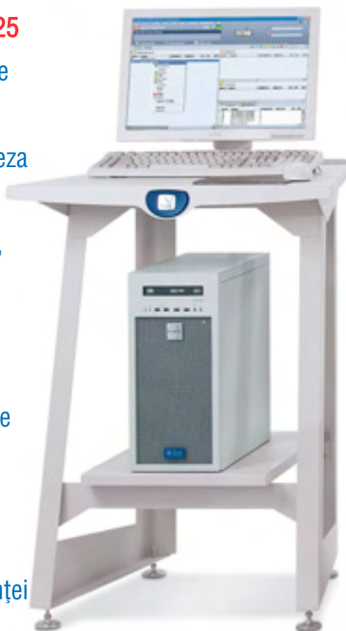
Serverul de imprimare FreeFlow