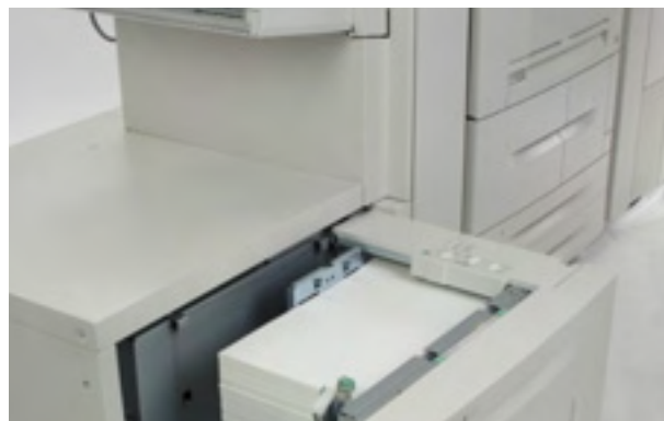
Media / Alimentare / Finisare