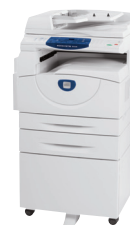
WorkCentre 5020DN cu dispozitivul automat de alimentare față-verso, tava 2 și standul opțional

Însemnul CE pentru Directivele 2006 / 95 / EC, 2004 / 108 / EC, 1999 / 5 / EC