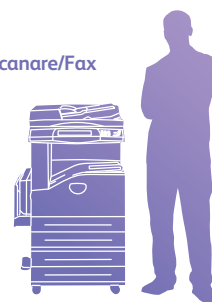
WorkCentre 5222 cu modulul adițional cu două tăvi