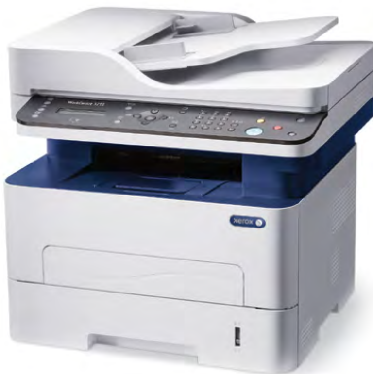
WorkCentre 3215. Copiere. Imprimare. Scanare. Fax. E-mail.