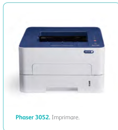
Phaser 3052. Imprimare.