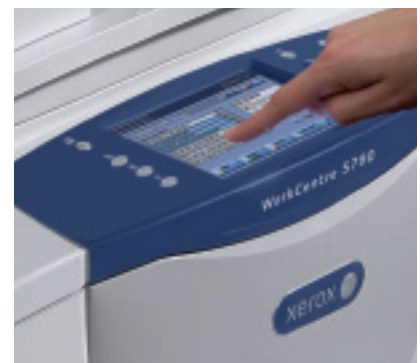
Soluții personalizate, accesibile prin intermediul interfeței cu ecran tactil.

Aplicația software ScanFlowStore creată de Nuance® reduce considerabil timpul de procesare a unui document datorită tehnologiei performante Optical Character Recognition. Folosind scanarea pe bază de șablon, un utilizator nu trebuie decât să specifice „porțiunile” din document ce conțin date specifice domeniilor medical, sau financiar, pentru ca acestea să fie scanate și folosite pentru denumirea fișierelor, crearea directoarelor de rețea, completarea rubricilor de proprietăți PDF, căutare și recuperare, precum și direcționarea documentelor scanate către destinațiile corecte.