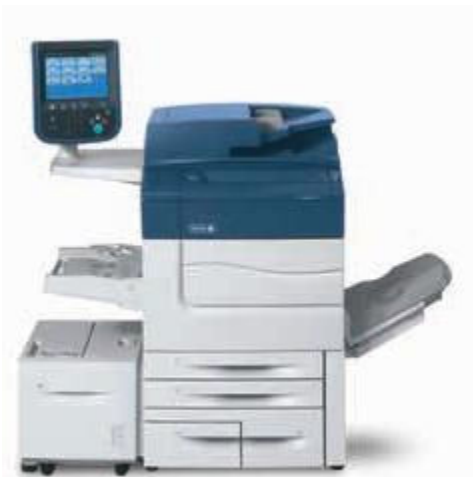
Xerox® C60/C70 ilustrat cu dispozitivul de alimentare de mare capacitate.