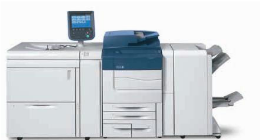
Xerox® C60/C70 ilustrat cu dispozitivul de alimentare de mare capacitate supradimensionat, cu o tavă și modulul de finisare BR cu dispozitiv de broșurare.