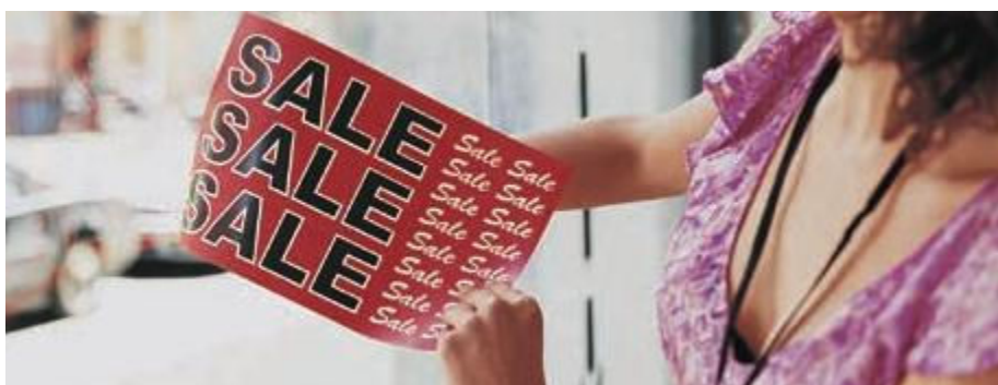
Afișe pentru vitrină imprimate pe Xerox® NeverTear

Tonerul nostru special EA cu punct de topire scăzut aderă perfect pe suprafețele din poliester prin intermediul unei metode patentate de creare a unei legături chimice, ce asigură calitatea superioară a imaginii pe tipuri speciale de suporturi, precum poliesterul etc. Premium NeverTear, pe care se poate imprima cu tonerul nostru EA, este rezistent la apă, ulei, grăsime și rupere.