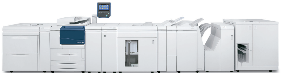
Echipamentul multifuncțional Xerox® D136 ilustrat cu dispozitiv de alimentare de mare capacitate supradimensionat cu 2 tăvi, GBC® AdvancedPunch™, stivuitor de mare capacitate, dispozitiv de finisare Standard Plus, dispozitiv de broșare, dispozitiv de inserare post-procesare și dispozitiv de legare cu bandă.