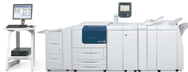
Imprimanta Xerox® D136 ilustrată cu dispozitiv de alimentare de mare capacitate, GBC AdvancedPunch, dispozitiv de finisare Standard, dispozitiv de pliere și dispozitiv de inserare post-procesare.