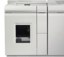
Modul de finisare Basic Plus