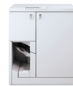
Dispozitiv de legare cu bandă Xerox®