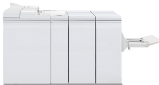
Dispozitiv de legare tip caiet Plockmatic Pro 30 (Disponibil doar la 120/144/157)