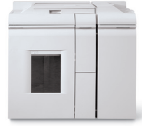
Modul de finisare Basic – Conectare directă