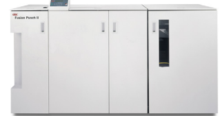
GBC FusionPunch II cu stivuior offset