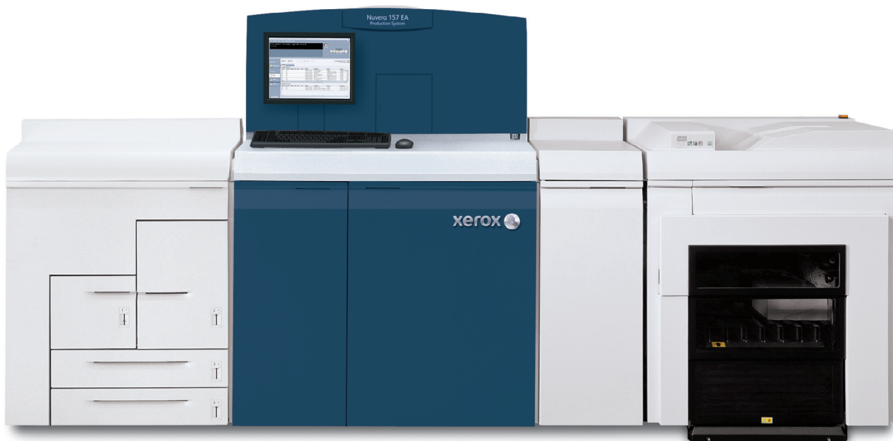
Sistemul de producție Xerox Nuvera® 157 EA cu stivuior de producție Xerox®