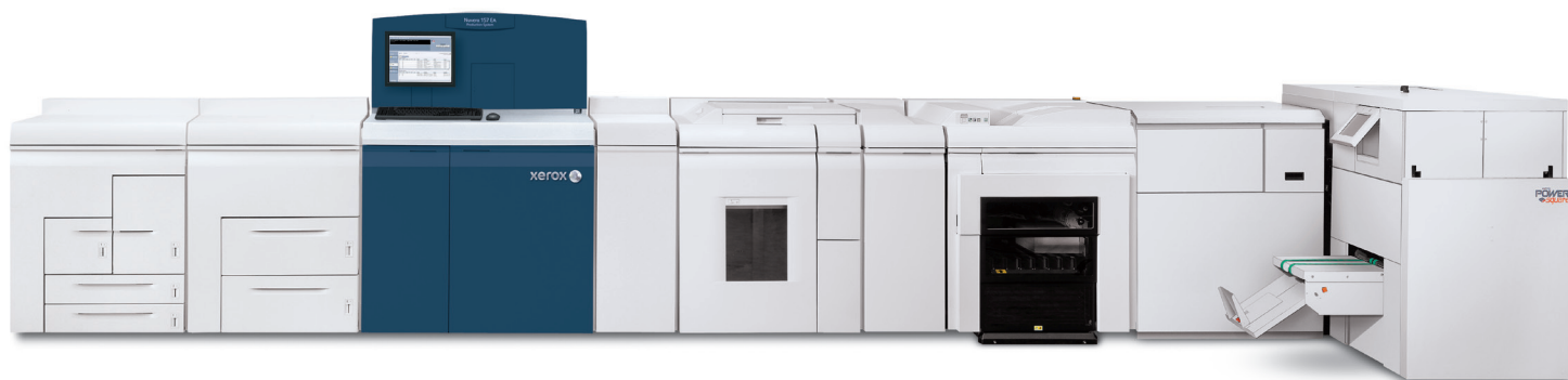
Sistemul de producție Xerox Nuvera® 157 EA cu stivuior de producție Xerox® și Watkiss PowerSquare 200