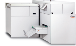
Watkiss PowerSquare 200