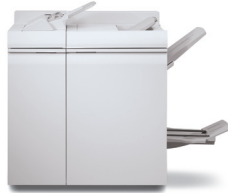
Dispozitiv de finisare multifuncțional Pro Plus