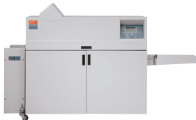
Dispozitiv de legare tip caiet cu margine dreaptă C.P. Bourg BDFNx