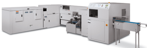
Xerox® Book Factory