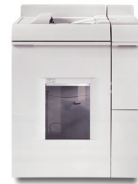
Modul de finisare Basic