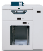
Modul de alimentare avansat C.P. Bourg BSFx