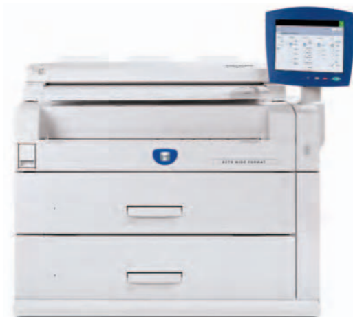
Copier/printer cu scanner integrat