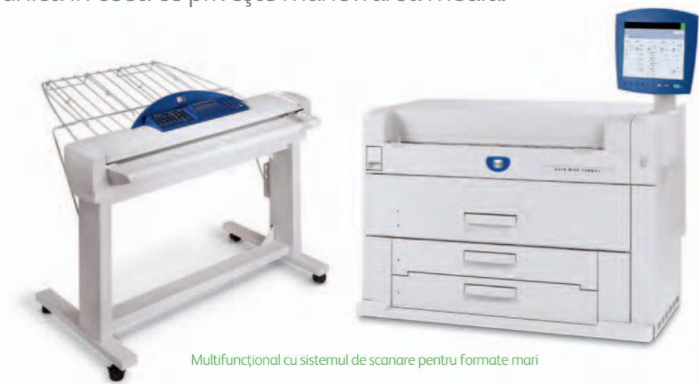
Multifuncțional cu sistemul de scanare pentru formate mari

Viteza 6279 poate fi îmbunătățită de la 7 la 9 formate D/A1 pe minut și este disponibil în variante cu 2 role, 4 role sau 2 role/2 tăvi.