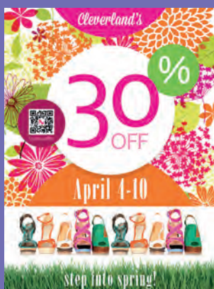
Punct de vânzare

Producerea lucrărilor supradimensionate în cantități mari a implicat întotdeauna acceptarea unui compromis—plus utilizarea mai multor imprimante, mai multe treceri prin alte echipamente și mai multe zile pentru realizarea cerințelor unui singur client. Nu-i de mirare că astfel de lucrări nu erau văzute cu ochi buni. Cu Xerox IJP 2000 însă, reprezintă o adevărată oportunitate de câștig.